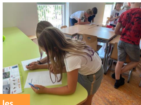
Een opdracht uit een les Vreedzame school in groep 7